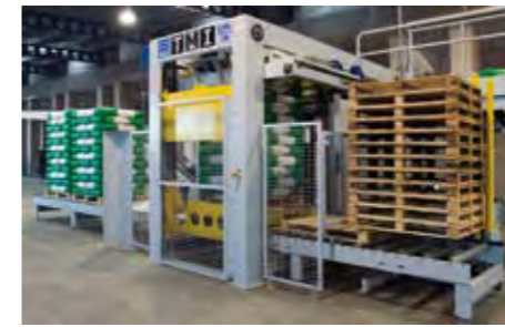
Dispensateur automatique de palettes