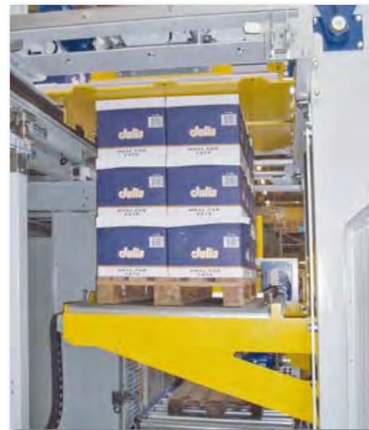
Palettisation de boîtes