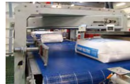
Modules spéciaux pour hautes prestations