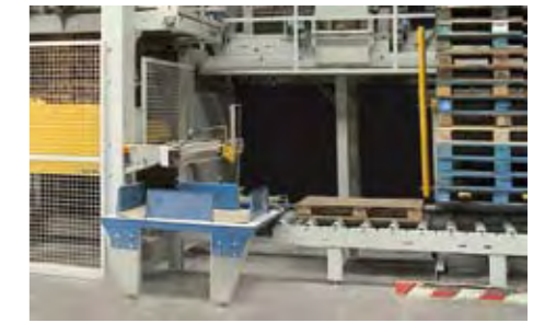
Dispensateur de la feuille en carton