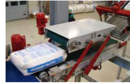
Conditionneur de sacs à bande motorisée