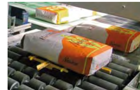
Orientation de sacs avec grille tournante