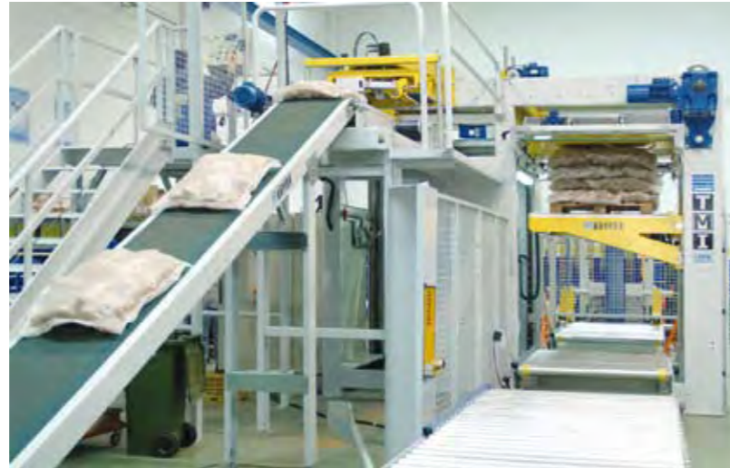
Pommes de terre