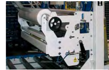
Dispensateur de film PE