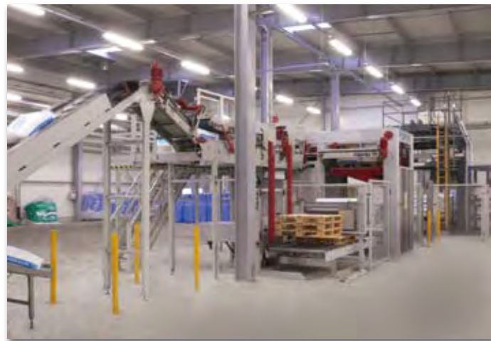
Lignes de palettisation et d'emballage complètes

Différents sortes de dispensateurs de palettes et de systèmes de pré-conditionnement des sacs.