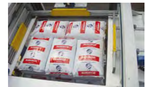
Pressage lors de la formation des couches