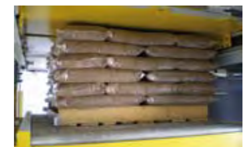
Repassage supérieur des couches