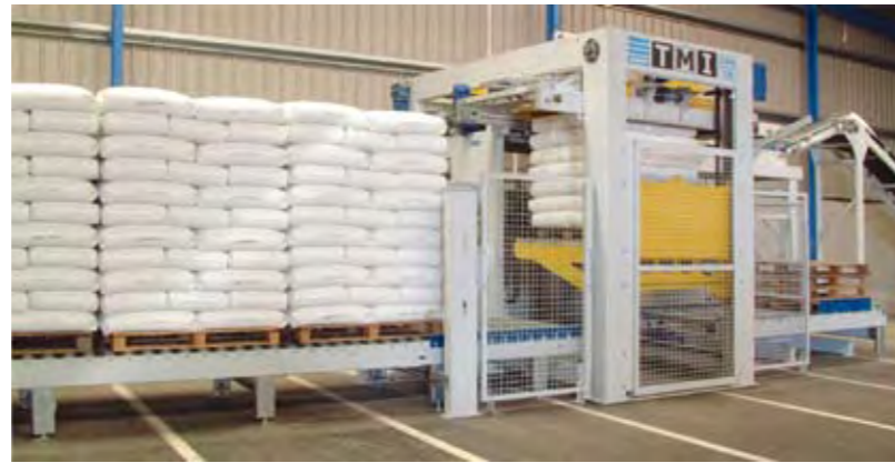
Granules de plastique