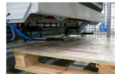
Système automatique d'agrafage du film sur la palette