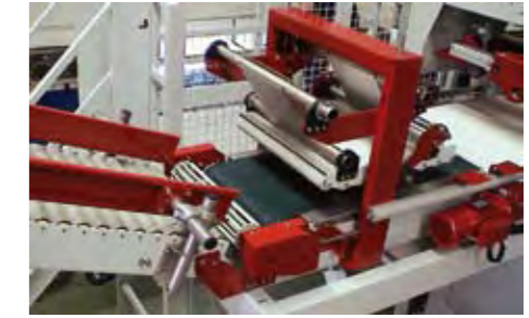
Traitements spéciaux pour produits corrosifs