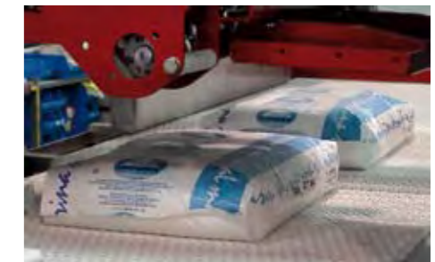
Orientation de sacs avec tournant FLAP