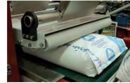
Conditionneur de sacs à rouleaux libres et bande motorisée